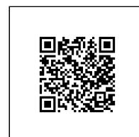
Zažádejte o vytyčení

Přílohy: Orientační zakres plynárenského zařízení, Detailní zakres plynárenského zařízení, Ověřená příloha žadatele